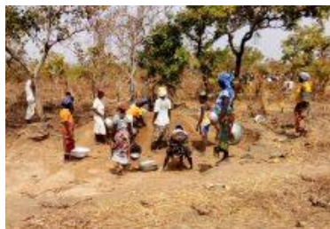
KAPLICA – GHANA