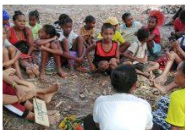
ŚWIETLICA – MADAGASKAR