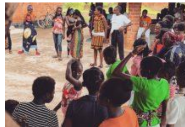
WYPOSAŻENIE ORATORIUM ZAMBIA