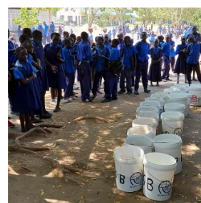
DOŻYWIANIE W SZKOLE