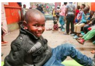
DOŻYWIANIE DZIECI – KENIA