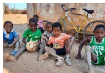
REMONT SZKOŁY MADAGASKAR