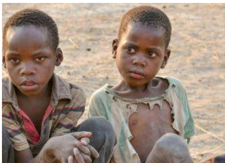
DOM NADZIEI – ZAMBIA