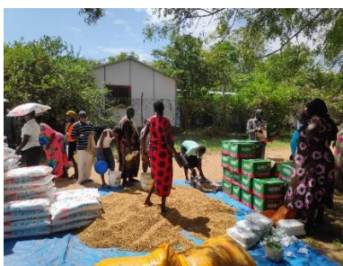
DOŻYWIANIE W OBOZIE DLA UCHODźCÓW