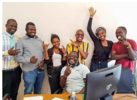
SIEĆ MŁODZIEŻOWA – ZAMBIA