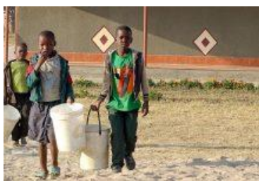
DOM DZIECKA – ZAMBIA